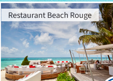
Restaurant Beach Rouge